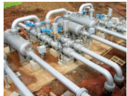
Gasdruckregel- und Messanlagen