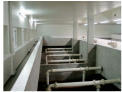
Sanierung einer Filterhalle