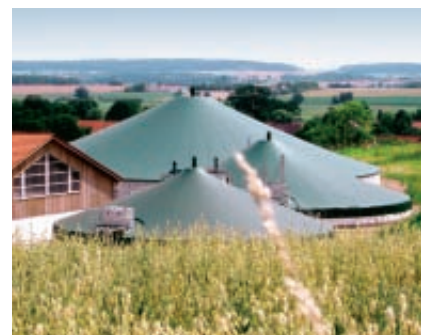
Einspeisung von Biogas