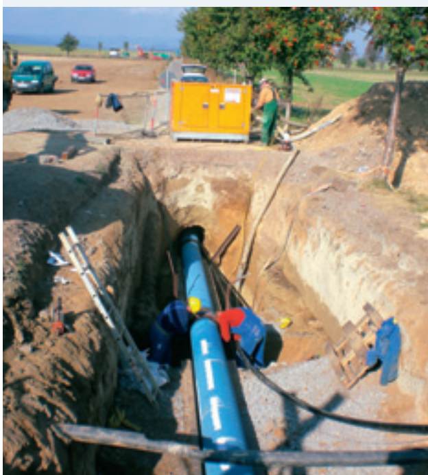
Für den grabenlosen Einbau bestens geeignet: Duktile Gussrohre mit einer BLS®-Steckmuffenverbindung.