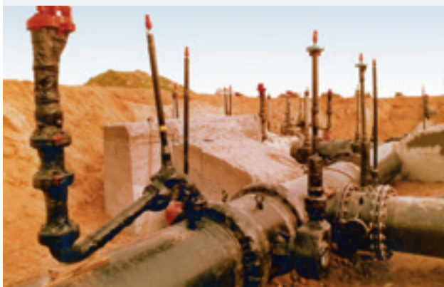
Bei nicht längskraftschlüssig verlegten Rohrleitungen sorgen Widerlager für die Aufnahme entstehender Kräfte.

Grabenlose Kanalsanierung: Kombinations-Liner für Lebensmittelabwässer .. 32